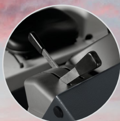
Palancas de control mecánico