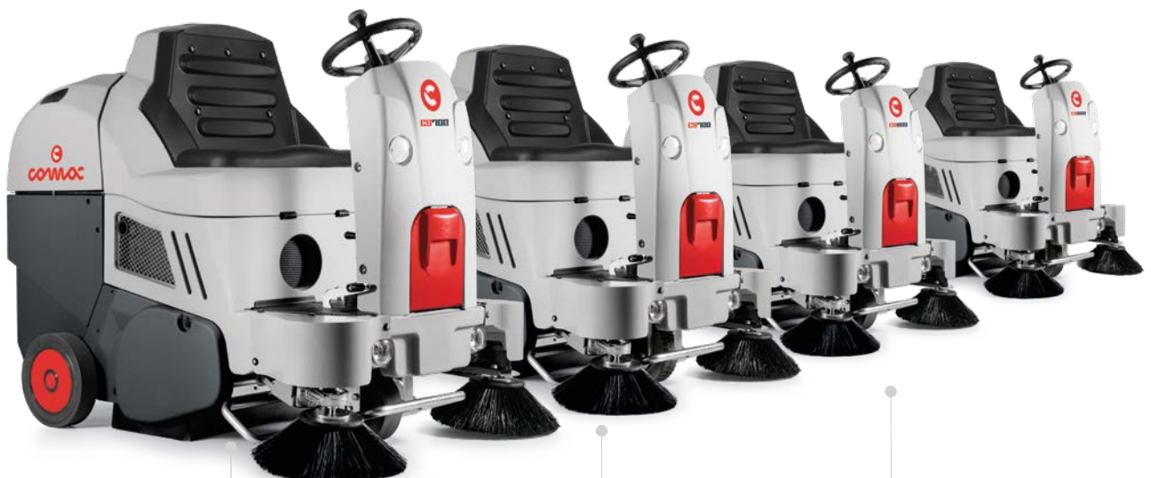
CS700 B Version batterie