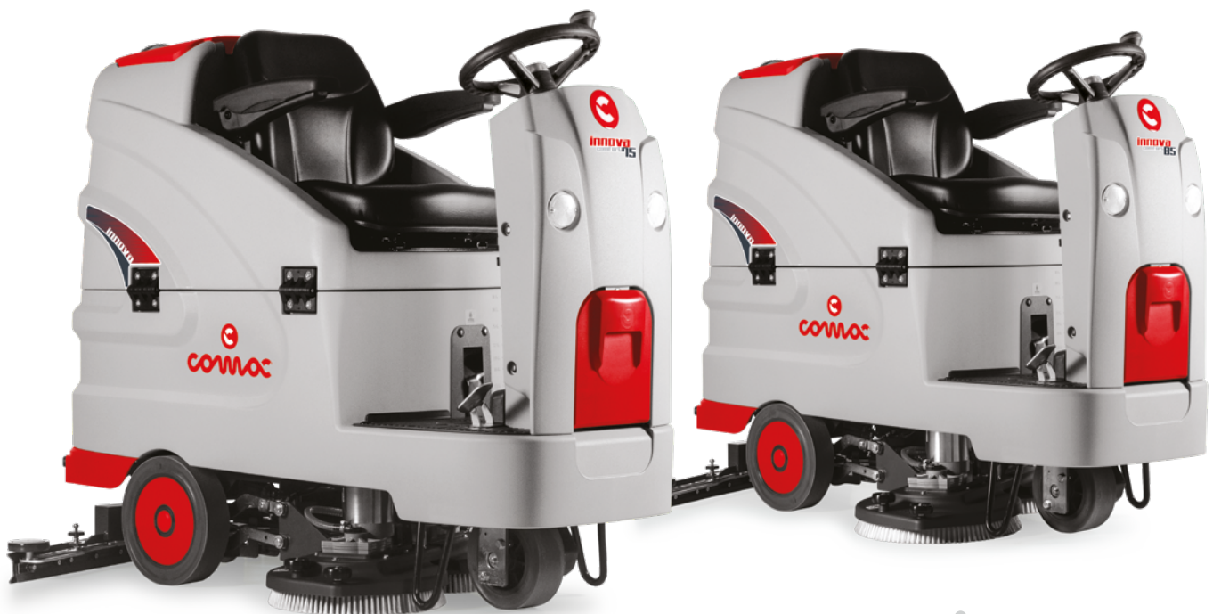
INNOVA COMFORT 75 B Versión fregadora con doble cepillo de disco Pista de trabajo: 750 mm