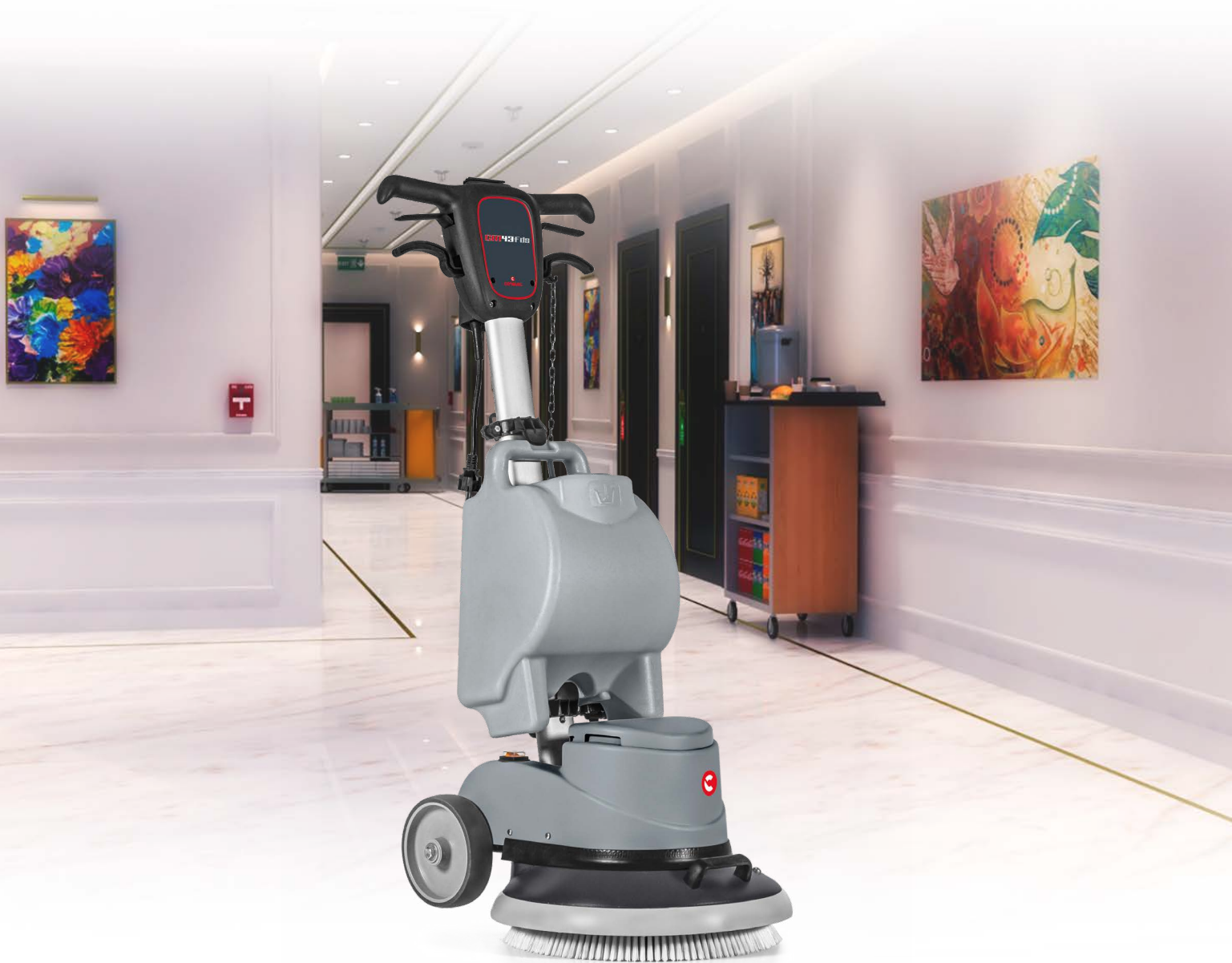
CM43 F DS Larghezza di lavoro: 430 mm Alimentazione: cavo Trasmissione: ingranaggi

CM43 F DS è la monospazzola professionale ideale per le imprese di pulizia e per le pavimentazioni di hotel e del settore Ho.Re.Ca. in genere, ma anche della GDO e dei trasporti.