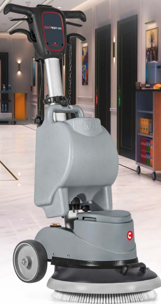
CM43 F DS Largeur de travail: 430 mm Alimentation: câble Transmission: engrenages

CM43 F DS est la monobrosse professionnelle idéale pour les entreprises de nettoyage et pour les sols des hôtels et du secteur Ho.Re.Ca. en général, mais aussi de la grande distribution et des transports.