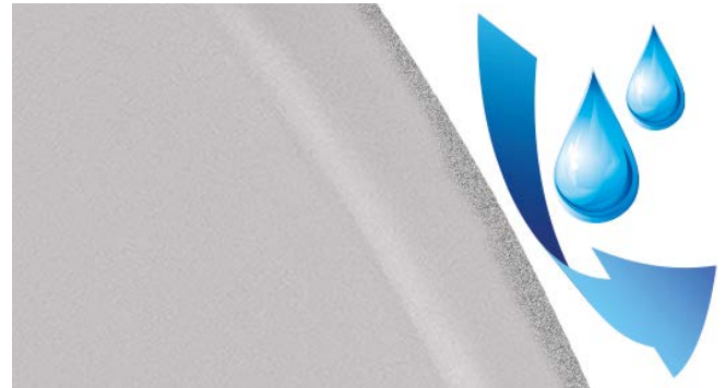
PLASTIQUE AVEC TRAITEMENT NETTOYAGE-FACILE